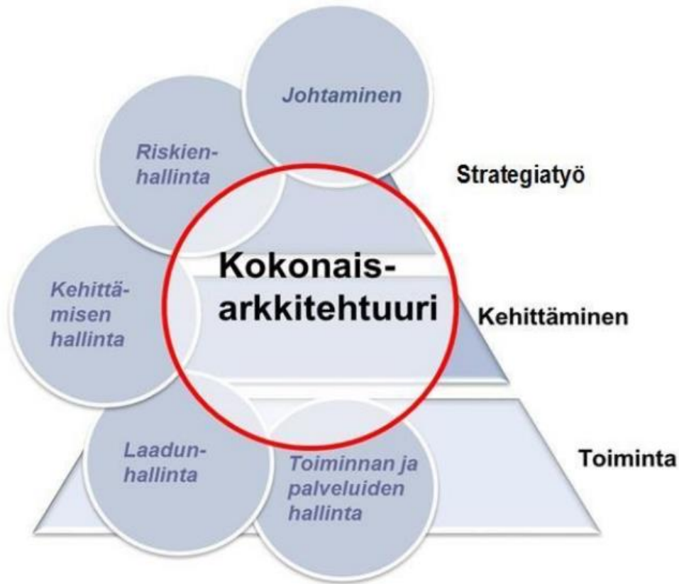
Kuva 1. Kokonaisarkkitehtuuri osana toiminnan kehittämistä.